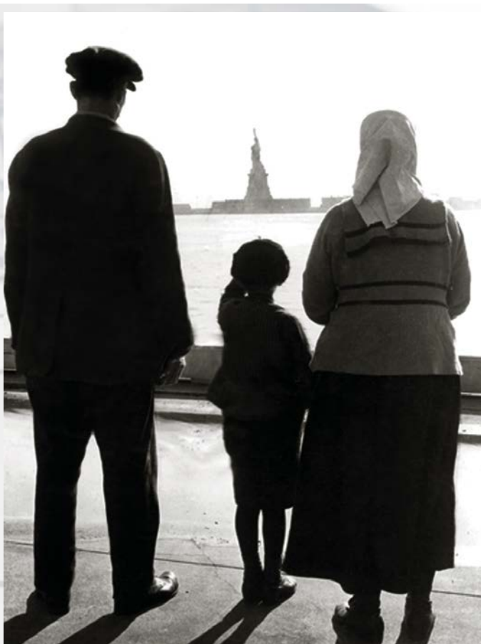
Бесплатный комплект документов СИИ