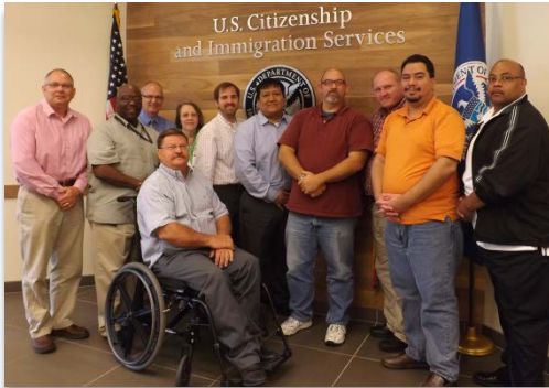
Nuestro equipo de asistencia en DACA en Overland Park, Kansas

U.S. Citizenship and Immigration Services